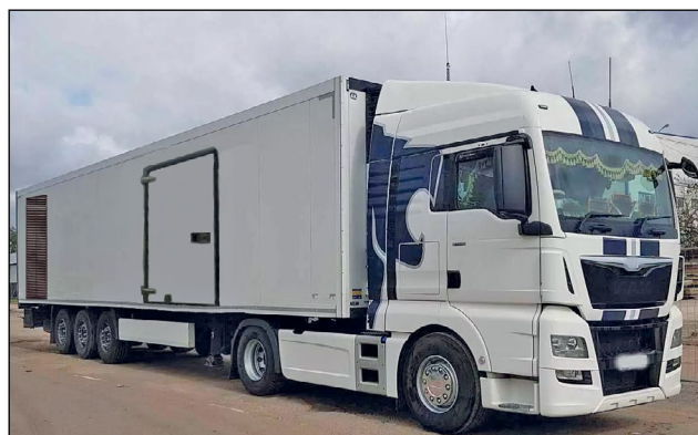
Рис. 2. Передвижной комплекс для проведения виртопсии.