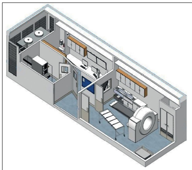
Рис. 1. Схема передвижного комплекса для проведения виртопсии.