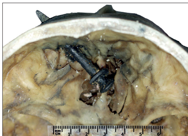
Рис. 2. Основание черепа, передняя черепная ямка. Выступающий из чешуи лобной кости конический конец металлического инородного тела — дюбель-гвоздя 4,5×60 мм, фиксированного в чешуе лобной кости.