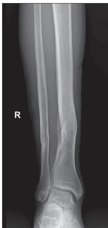
Рис. 1. Рентгенограмма правой голени в прямой проекции. Старые сросшиеся переломы нижней трети диафизов берцовых костей.

Fig. 1. Radiograph of the right shin in a direct projection. Old fused fractures of the lower third of the tibial diaphysis.