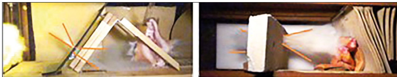
Рис. 2. Покадровое воспроизведение прохождения огнестрельного снаряда через преграду и биологическую мишень: a — триплекс; b — комбинированная преграда из керамогранита и пенобетона.