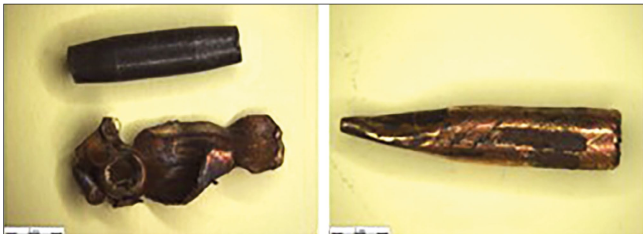
Рис. 1. Вид пуль патрона 5,45×39 после пробития преграды: a — из триплекса; b — комбинированной преграды из керамогранита с пенобетоном и биологической мишени.

Проведённое исследование подтвердило, что стабильный перенос вещества преграды на огнестрельный снаряд и его фрагменты отмечается как при выстрелах патронами с низкоскоростными пулями без поражения биологического объекта [10], так и высокоскоростными пулями после поражения биологического имитатора тела человека.