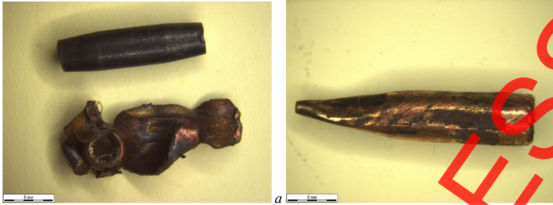
Рис. 1. Вид пуль патрона 5,45×39 после пробития преграды: a — из триплекса; b — комбинированной преграды из керамогранита с пенобетоном и биологической мишени.

Fig. 1. Type of bullets of the 5.45×39 cartridge: a — after breaking through the triplex barrier; b — after breaking through the combined barrier of porcelain stoneware with foam concrete, as well as a biological target.