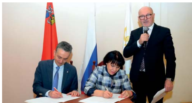
Торжественное подписание меморандума о сотрудничестве.