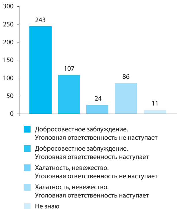
Рис. 1. Распределение ответов на вопрос «Как вы понимаете термин "врачебная ошибка"» (n=426, несколько вариантов ответа).