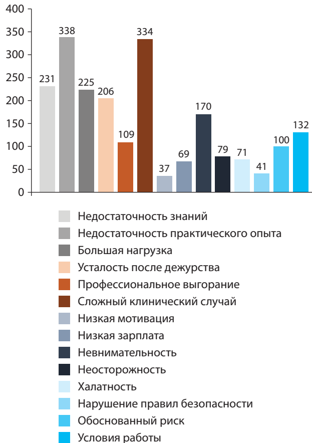
Рис. 2. Распределение ответов на вопрос «Наиболее вероятные причины совершения "врачебных ошибок"» (n=426, пять вариантов ответа).

По мнению 267 (62,7%) опрошенных, медицинский работник должен сообщать пациенту о совершённой при диагностике/лечении ошибке, 63 (14,8%) считают,