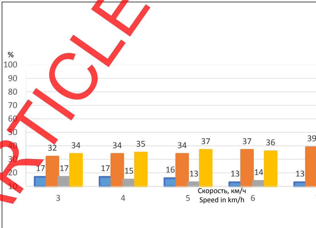
Fig. 1. Change of step step intervals depending on speed, where step cycle length is expressed in fractions of one.