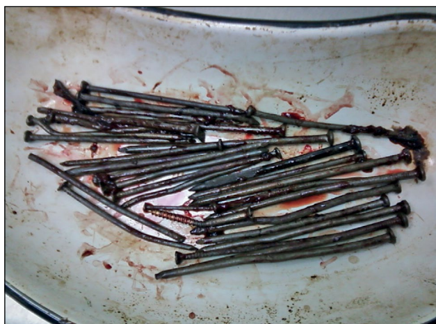
Рис. 3. Металлические гвозди (32 шт.), извлечённые во время операции.