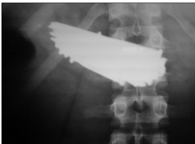
Рис. 2. Рентгенограмма органов брюшной полости (фронтальная проекция).