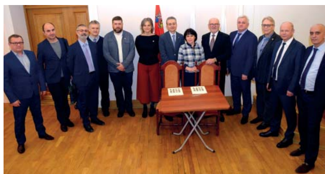
Торжественное подписание меморандума о сотрудничестве. The Solemn signature of memorandum of cooperation.