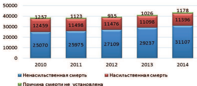
Рис. 2. Структура судебно-медицинских исследований трупов в зависимости от категории смерти, по данным ГБУЗ МО «Бюро СМЭ» в 2010–2014 гг.

По количеству произведенных экспертиз и экспертных исследований трупов Бюро судебно-медицинской экспертизы Московской области является самым крупным в России. Последние пять лет фиксируется волнообразное колебание количества поступивших