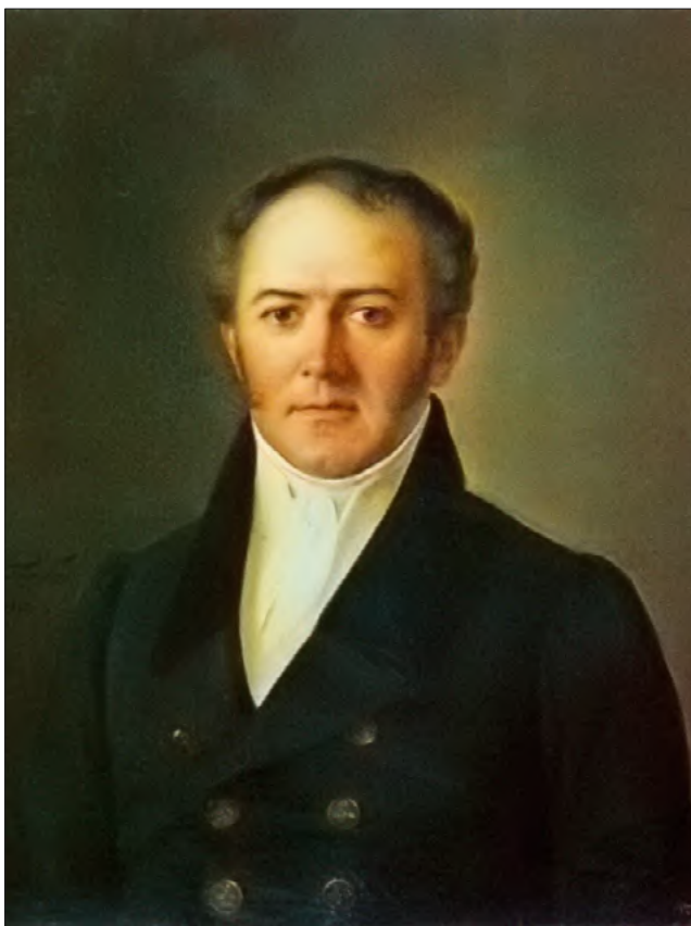
И. В. Буяльский. Портрет работы М. И. Тербенева

дателя, трех действительных и «неопределенного числа» почетных членов, преимущественно из профессоров и академиков. Вплоть до 1904 года (дата преобразования Медицинского департамента в Управление главного врачебного инспектора) Совет являлся в России высшим органом по «врачебно-ученым, врачебно-полицейским и врачебно-судебным делам».