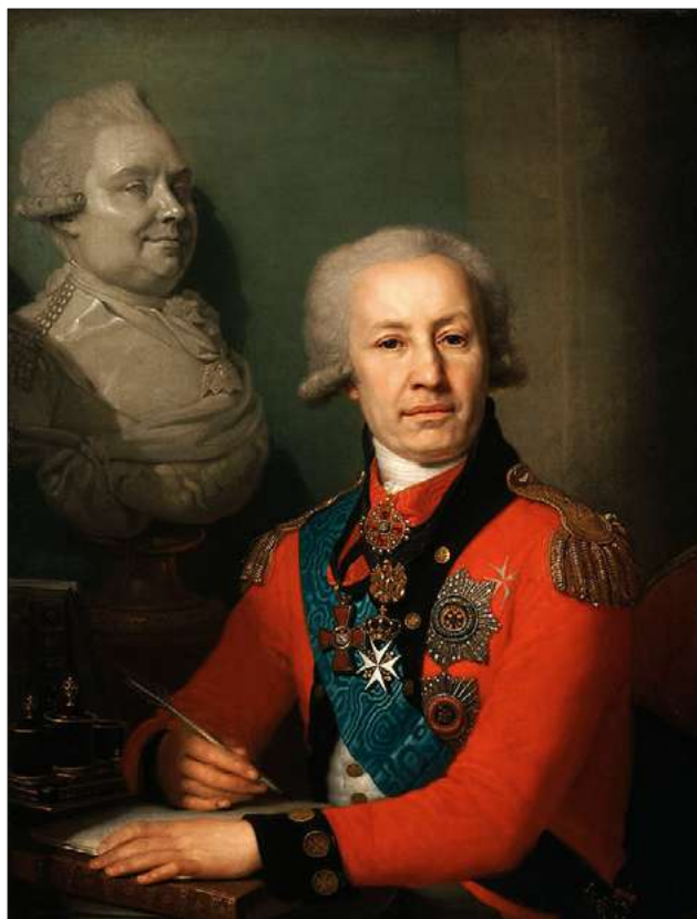
А. И. Васильев, главный директор Медицинской коллегии (с 1793 г.), сенатор. Портрет работы В. Л. Боровиковского

В начале XIX века на смену самостоятельной Медицинской коллегии пришел Медицинский совет в составе Министерства внутренних дел. В 1808 году Московская контора перешла в ведение Медицинского департамента МВД. 1 апреля 1809 года врачевным управам, Физикату и Медицинской конторе было предписано получать от подведомственных врачей копии актов исследования трупов. В случаях бесспорной причины смерти проводить судебно-медицинское вскрытие надлежало только тогда, когда это диктовалось материалами расследования. При Николае I штат Медицинского совета состоял из предсе-