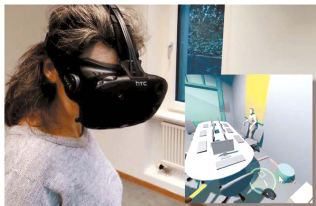
Рис. 1. Человек в системе виртуальной реальности.

Перед тем как рассмотреть потенциальные возможности применения виртуальной реальности в уголовном правосудии, необходимо ознакомиться с основами этой технологии. Термин «виртуальная реальность» впервые появился в конце 1980-х годов и относится к искусственно созданной, трёхмерной и интерактивной среде, заменяющей физическую окружающую среду. Другими словами, это компьютерно-генерируемая область, которая имитирует реальный мир и позволяет пользователям взаимодействовать с ней [3]. Взаимодействие человека и компьютера в виртуальной среде естественным образом происходит через иммерсивные технологии, такие как головной дисплей (рис. 1). Этот опыт обеспечивает погружение пользователя в виртуальный мир, позволяя взаимодействовать с ним в режиме реального времени [4]. Погружение и присутствие в виртуальной среде создаются с использованием различных сенсорных модальностей, таких как визуальный и слуховой ввод, а также дополнительные элементы, например тактильные перчатки. В научной литературе