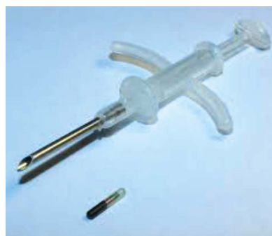
Рис. 1. Имплантация чипа. Fig. 1. Chip implantation.

С 1991 года в Казахстане при исполнении служебных обязанностей погибло более 800 сотрудников правоохранительных органов, более 4,5 тыс. получили ранения разной степени тяжести. Чипирование сотрудников могло бы способствовать их быстрому обнаружению для обеспечения безопасности либо сохранения жизни