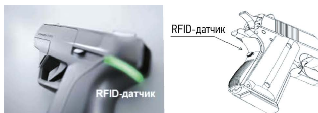
Рис. 6. Пистолет с RFID-датчиком. Fig. 6. Gun with RFID sensor.