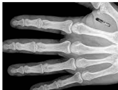
Рис. 2. Рентген руки с чипом. Fig. 2. X-ray of a hand with a chip.