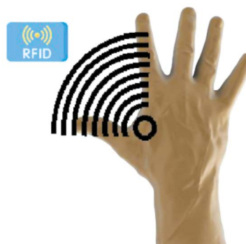
Рис. 3. Взаимодействие чипа и RFID. Fig. 3. Interaction of chip and RFID.