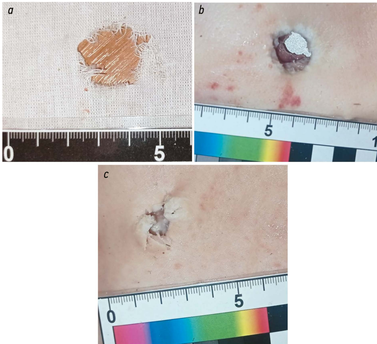
Рис. 2. Экспериментальное огнестрельное повреждение, причинённое пулей патрона «УНО 35»: на хлопчатобумажной бязи (a); входное (b) и выходное (c) огнестрельное отверстие на коже биологического имитатора тела человека.

Fig. 2. Experimental gunshot damage after firing UNO 35 cartridge: a — on cotton fabric; b — an entrance gunshot hole at biological simulator skin; c — an exit gunshot hole at biological simulator skin.