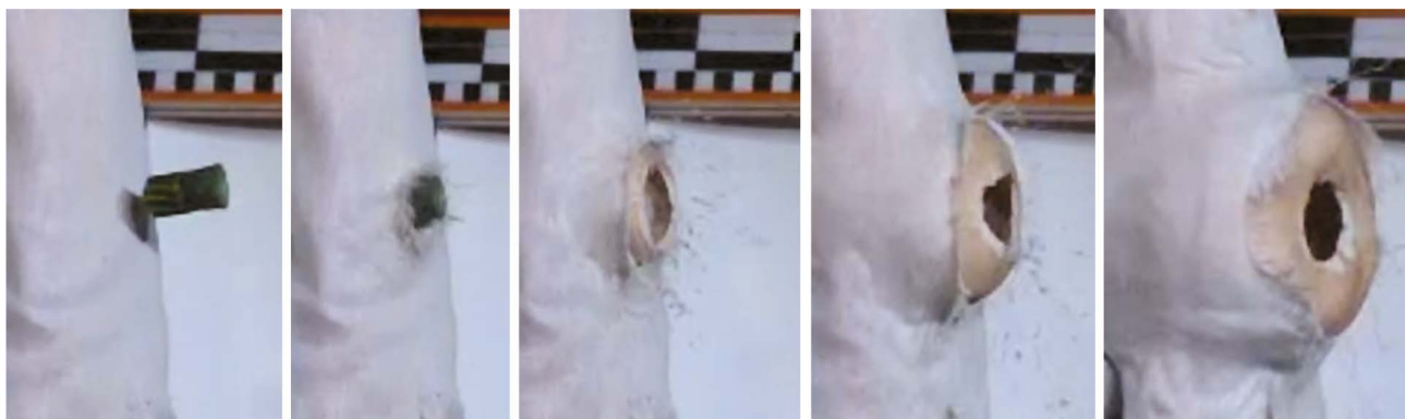
Рис. 4. Покадровое воспроизведение процесса поражения мишени пулей к патрону «УНО 353».

Вклад авторов. Все авторы подтверждают соответствие своего авторства международным критериям ICMJE (все авторы внесли существенный вклад в разработку концепции, проведение исследования и подготовку статьи, прочли и одобрили финальную версию перед публикацией). Наибольший вклад распределён