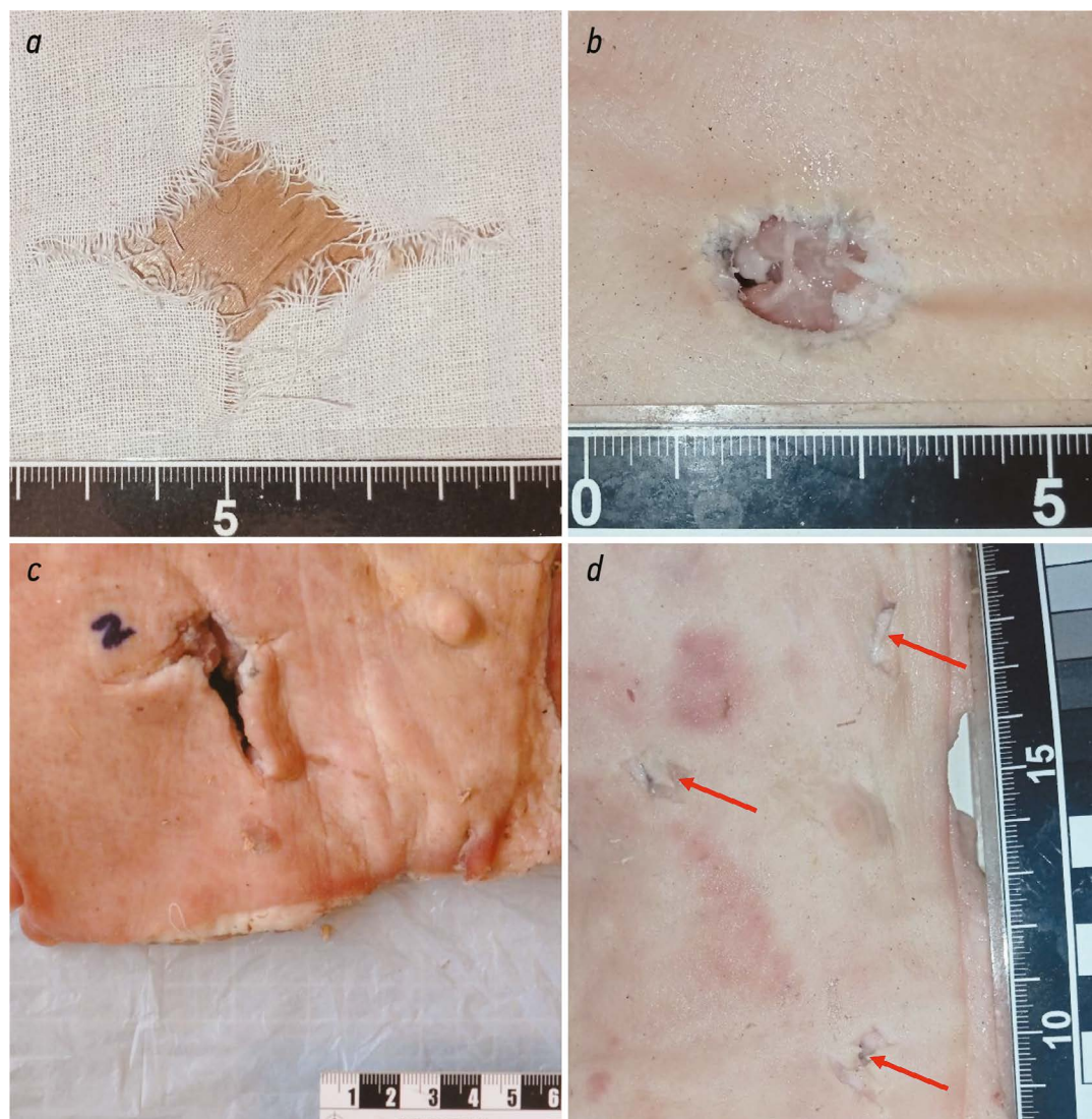
Рис. 3. Экспериментальное огнестрельное повреждение, причинённое пулей патрона «УНО 353»: на хлопчатобумажной бязи (a); входное огнестрельное отверстие на коже биологического имитатора тела человека без выраженных радиальных разрывов (b); входное огнестрельное отверстие на коже биологического имитатора тела человека с выраженными радиальными разрывами (c); выходные огнестрельные отверстия (стрелки) на коже биологического имитатора тела человека (d).

Fig. 3. Experimental gunshot damage after firing UNO 35E cartridge: a — on cotton fabric; b — an entrance gunshot hole without pronounced radial tears at biological simulator skin; c — an entrance gunshot hole with pronounced radial tears at biological simulator skin; d — exit gunshot holes at biological simulator skin (marked with red arrows).