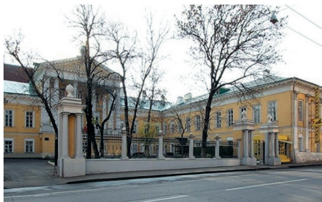
Рис. 6. Усадьбы Барышникова на Мясницкой, 42 (на фотографии общий вид здания, 2017 г.)