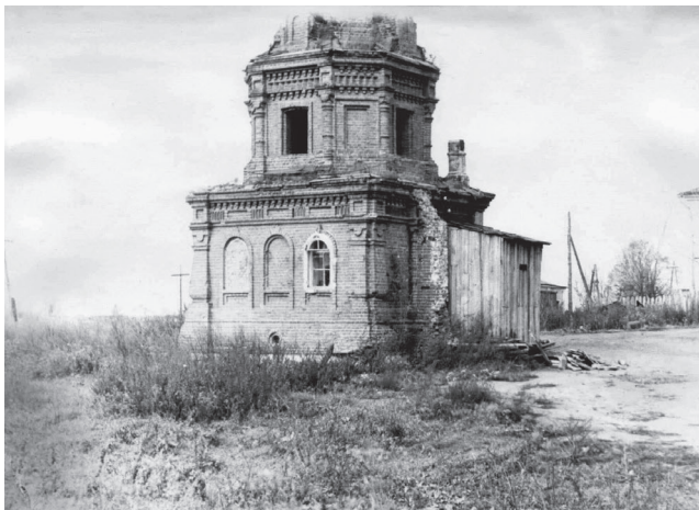
Рис. 3. Так выглядели морги в период становления судебно-медицинской экспертизы в послереволюционной Московской губернии (приспособленная часовня в Волоколамском районе)

экспертов было трудно. Еще все так же слаба была материально-техническая база службы, на экспертов все так же ложилась колоссальная нагрузка по обслуживанию уездов.