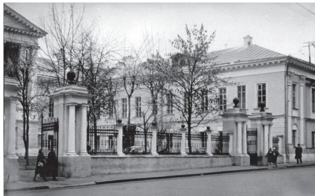
Рис. 5. В этом здании на ул. Мясницкой, 42, располагалось помещение судебно-медицинской экспертизы (на фотографии общий вид здания, 1967 г.)